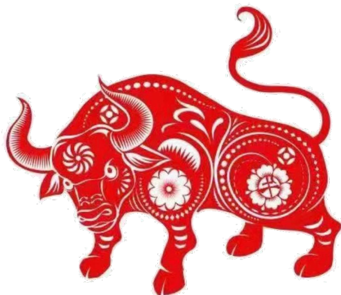
2021, Ano do Boi.

A CBKW deseja a todos os praticantes de Kungfu Wushu um feliz Ano Novo Chinês.