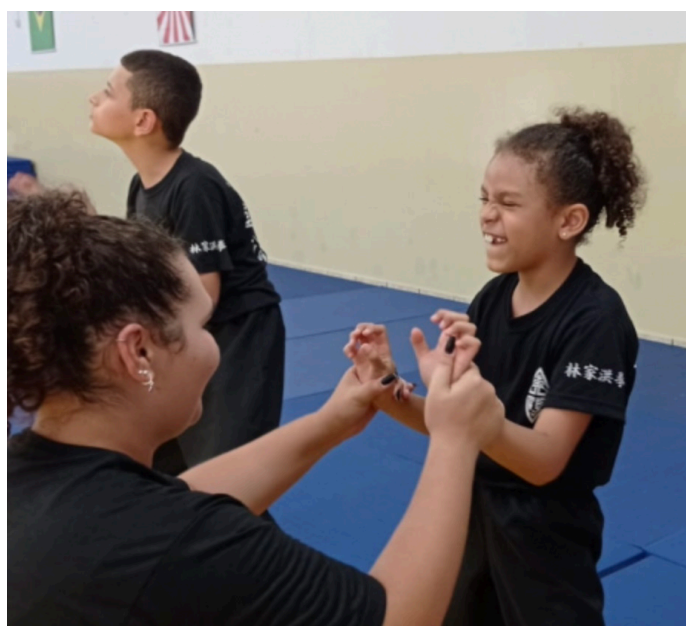
Kungfu para crianças com autismo.

O Kungfu em sua vasta diversidade é uma modalidade muito inclusiva, e iniciativas como estas destacam o poder de transformação que o Kungfu pode exercer na sociedade. Uma amostra de como ampliar as possibilidades de atuação e de contribuição de forma inovadora e inspiradora.