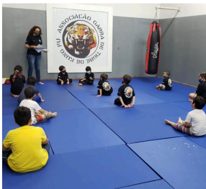
Socialização em aulas coletivas.