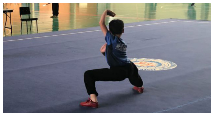
Treino do time júnior de taolu moderno.

Em Setembro é a vez dos atletas de Wushu Interno enfrentarem a principal competição para o departamento, o 3º Campeonato Mundial de Taijiquan, que será realizado em Burgas na Bulgária. Serão 6 atletas que comporão a Seleção Brasileira para o evento, man-