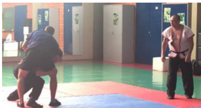
Atletas de Shuaijiao visam o Sul-Americano.

Logo no mês de Maio já está programado o 2º Campeonato Sul-Americano de Kungfu, a ser realizado em Montevideu no Uruguai. A Seleção Brasileira para a competição será composta por 46 atletas dentre Wushu Interno, Tradicional e Shuaijiao, sendo que os dois últimos têm nessa competição o evento internacional do ano.