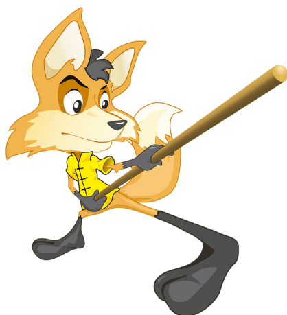
Gunshu com Guará, Mascote Oficial do Mundial.

O Brasil é um país ativo com participação na maioria das competições internacionais do calendário oficial da IWUF e sempre foi muito bem recebido pelos voluntários por onde passou, agora é nossa vez de mostrar a famosa receptividade do povo brasileiro e retribuir todo o carinho recebido ao longo de tantas competições.