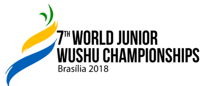
Logo Oficial do Mundial.

A CBKW disponibilizou em seu facebook um formulário de cadastro para todos aqueles que desejarem participar diretamente nesse momento histórico