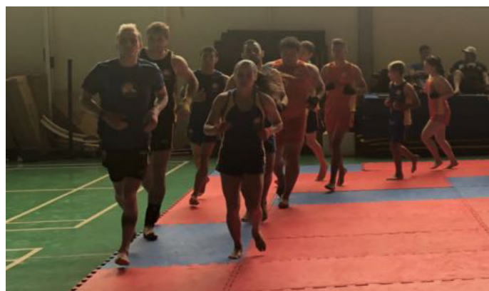
Aquecimento dos atletas de Sanda.

No mês de Julho será a vez do grande desafio para os