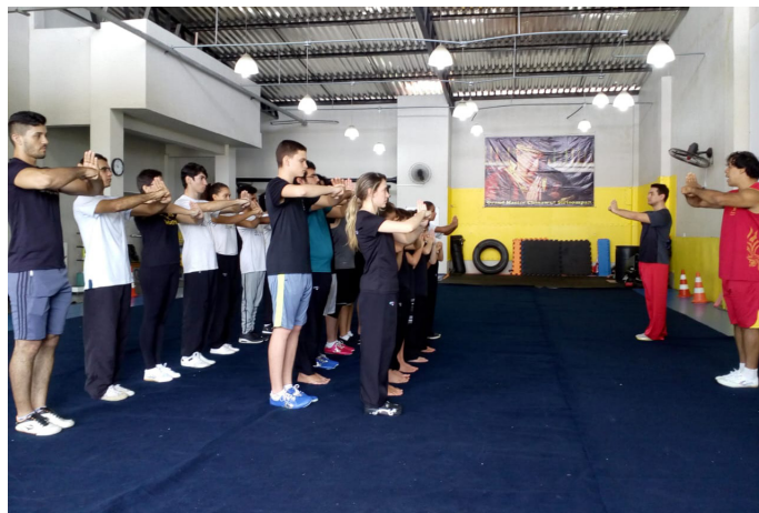
Início das atividades do curso.

A Federação Cearense de Kungfu Wushu realizou, através de parceria de sua Diretoria Técnica com o Departamento de Wushu Moderno da CBKW, um Curso de técnicas de Xingyiquan para seus filiados. Com participação de cerca de 20 pessoas a iniciativa visa difundir as técnicas do estilo no estado, pois além de se tratar de um conteúdo muito tradicional, ele faz parte das categorias de competição das principais competições da modalidade: Campeonatos Mundiais de Kungfu, Wushu e Taijiquan.