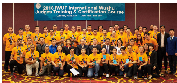
Participantes do Curso em Lubbock.

A IWUF promoveu no mês de abril o primeiro de uma série de três cursos para formação de árbitros internacionais em Lubbock nos EUA. O formato foi projetado para ofertar cursos em três continentes visando atender melhor aqueles que pretendem ser árbitros internacionais, estão programadas mais uma edição no continente europeu e outra no asiático, além desta edição que marcou a primeira vez do curso no continente americano. O Brasil se fez presente no curso com dois árbitros de Sanda e um árbitro de talou, todos obtiveram êxito e foram aprovados.