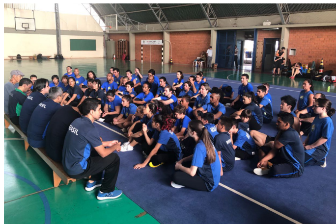
Reunião da comissão técnica com os atletas.