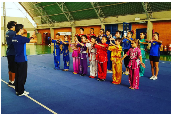
Atletas prontos para disputa das últimas vagas.

dos atletas. Os atletas retornaram a suas cidades e seguem com a preparação conforme as orientações recebidas visando atingir o melhor nível possível até as competições.