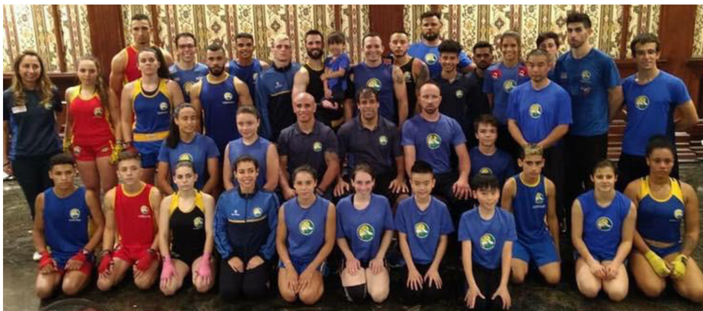
Delegação brasileiro no pan-americano.