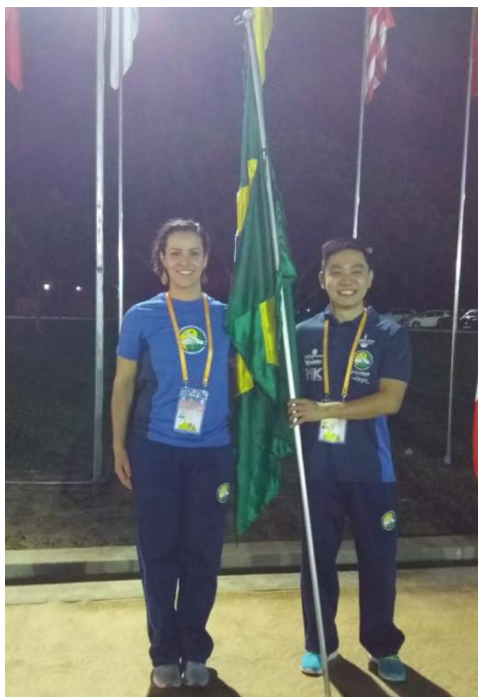
Atletas a postos para cerimonia de abertura.

A configuração das competições de taolu propiciam situações nas quais para se destacar é necessário superar diretamente mais de uma dezena de atletas profissionais de alto nível, observar atletas brasileiros superarem alguns destes atletas e alcançar resultados expressivos é algo notável. Isto é fruto da construção de um trabalho contínuo de promoção de intercâmbio técnico, que se materializa em resultados através do esforço pessoal de atletas dedicados.