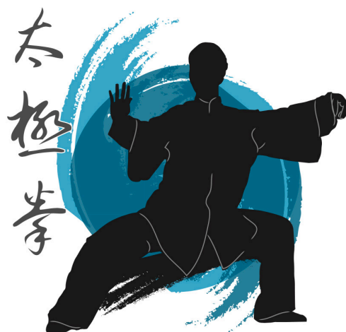
Postura de Taijiquan.