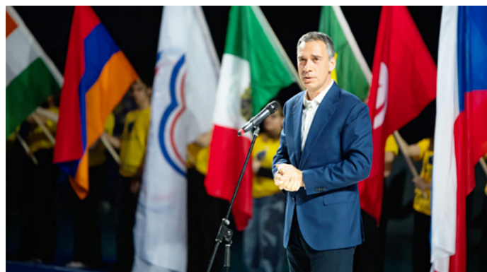
Dimitar Nikolov, prefeito de Burgas