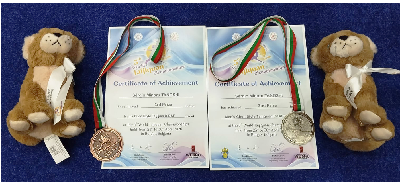
Como vitrine rumo aos Jogos Olímpicos da Juventude de Dakar 2026, o sucesso do torneio em Burgas consolidou o Brasil como força emergente e respeitada no Taijiquan mundial